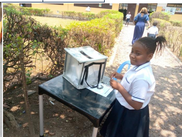
Electrice devant l'urne

L'investiture et la présentation de tout le comité scolaire ont eu lieu le vendredi 21 octobre 2023 devant toute la communauté scolaire, sous l'agrémentation du groupe de ballet «Sango Mbonda».