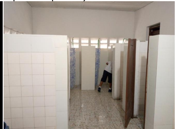
Sanitaires école primaire