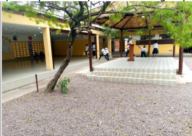
Préau école primaire

Depuis le mois de mars dernier, l'école a initié quelques travaux de rénovation qui ont concerné notamment le remplacement de toutes les planches de rive vétustes, le renouvellement de la peinture de tout le bâtiment, le carrelage du préau de l'école primaire et une partie de la cour de l'école maternelle, la réhabilitation du centre de santé avec la construction d'un bureau du médecin et la salle de kinésithérapie (qui se partageaient un local), la rénovation des toilettes (qui a été un épineux problème pendant très longtemps auprès des parents).