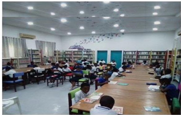
Die Bibliothek nach der Einweihung

Neben dem Erwerb der eigenen Dokumentensammlung profitiert die Bibliothek oft von der Unterstützung unserer Schweizer Partner, insbesondere von den Freiwilligen des Vereins "Les Amis de Lisanga", die, wann immer sich die Gelegenheit bietet, nach Kinshasa zu reisen, die Schule mit Romanen, Comics, pädagogischen Unterlagen und anderen Materialien versorgen.