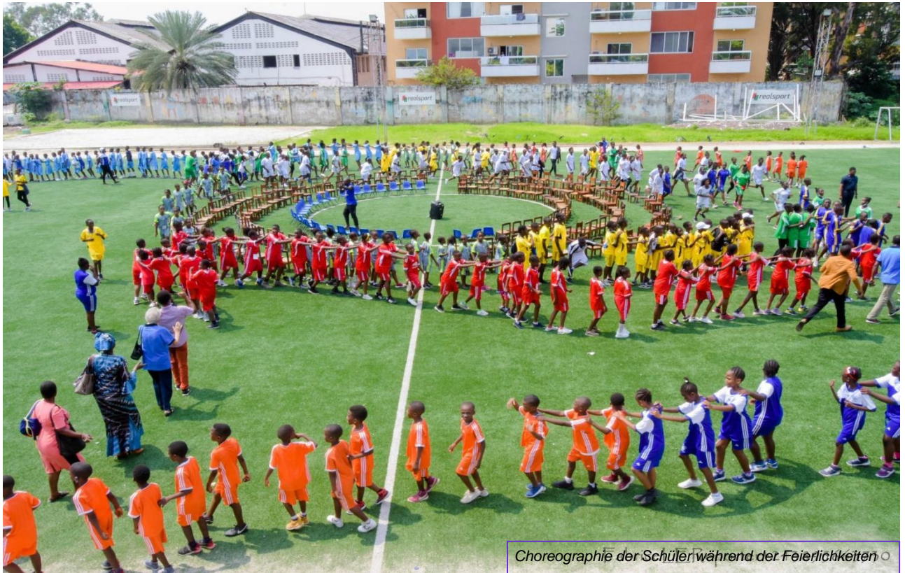
Choreographie der Schüler während der Feierlichkeiten ◦

ECHO VON LISANGA REDAKTION UND ADMINISTRATION : Communauté Lisanga B.P.73 Kinshasa1 Tél.00243851090394/ 00243851090404 comlisanga@yahoo.fr