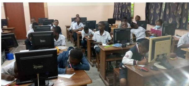
Der Computerraum während einer Unterrichtsstunde