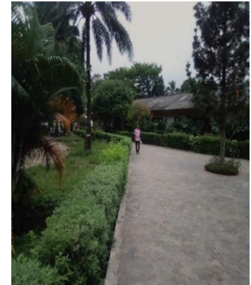
Die neue Strasse

Seit ihrer Gründung hat sich die Lisanga-Schule immer höhere Ziele gesteckt, um eine nachhaltige Entwicklung zu erreichen. Dies spiegelt sich in allen ihren Maßnahmen wider, sowohl in Bezug auf die Infrastruktur als auch auf die Verbesserung der Umwelt.