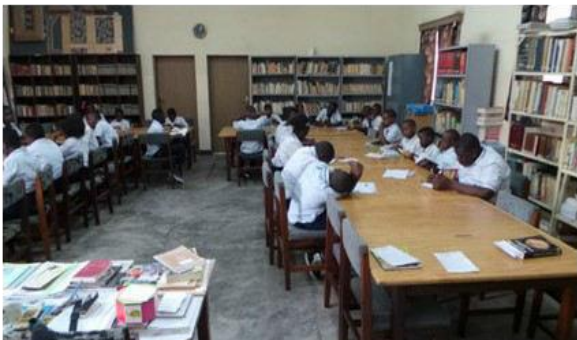
Bibliothek vor der Öffnung

Zu den Vorzügen, welche die Lisanga-Schule stark und besonders machen, gehören das psychosoziale Zentrum, der Computerraum, das medizinische Zentrum und die Bibliothek.