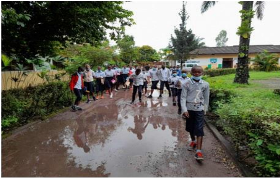
Situation vor der Verlegung der Pflastersteine